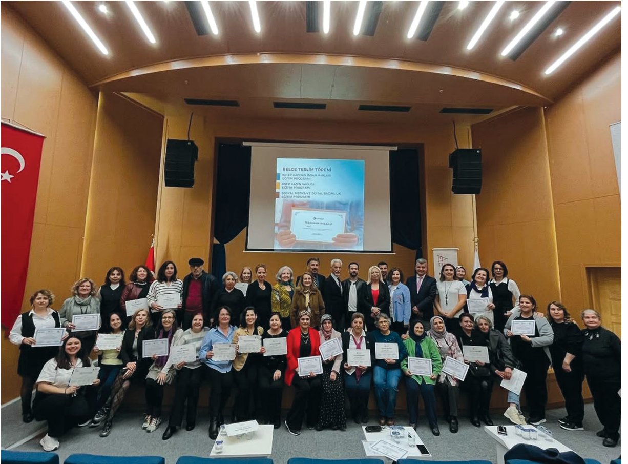
2024-2025 Dönemi KİHEP, KSEP, sosyal medya ve dijital bağımlılık eğitimleri katılım belgesi töreni

Karabağlar Kent Konseyi'nin en başarılı olduğu alanlardan biri, çeşitli sosyal grupların temsil edilmesini sağlayan meclisler ve çalışma grupları aracılığıyla kapsayıcı bir model geliştirmesidir. Kadın Meclisi, Engelli Meclisi, Gençlik Meclisi gibi yapılar, demokratik katılımın genişletilmesi açısından önemli imkanlar sunmaktadır.