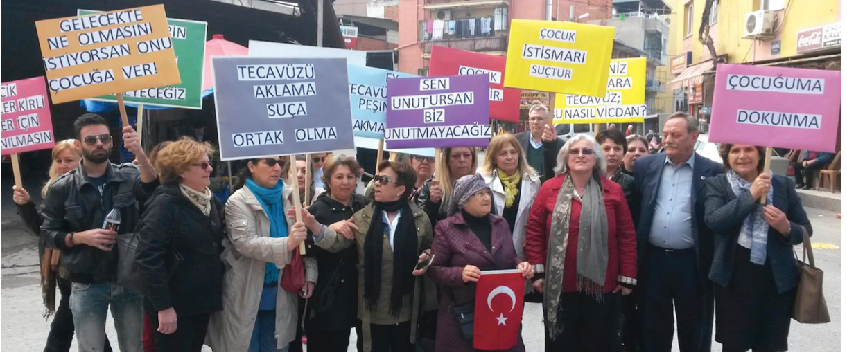
Karaman'da yaşanan çocuklara istismarına karşı Karabağlar sokaklarında protesto, 2016

2. Çalışma Gruplarına Katılım: Ekolojik Denge ve Hayvan Hakları Çalışma Grubu, Semt Merkezi Çalışma Grubu, Temel Afet Bilinci Çalışma Grubu, Ruh Sağlığı Çalışma Grubu Bilişim ve Dijital İletişim Çalışma Grubu, Engelli Anneleri Çalışma Grubu, Parasız Bilimsel Laik Eğitim Çalışma Grubu, İklim Değişikliği Çalışma Grubu, Emekli Destek ve Dayanışma Çalışma Grubu gibi çeşitli çalışma grupları bulunmaktadır. Çalışma grupları, belediyede yaşayan yurttaşların talepleriyle şekillenmekte ve ihtiyaca göre ve öneriler doğrultusunda yenileri kurulabilmekte ve bazıları işlevini yitirebilmektedir. Örneğin Göçmenler Çalışma Grubu, LGBTİ+ Çalışma Grubu, Çocuk Hakları Çalışma Grubu, Hayat Yeniden Yardımlaşma Çalışma Grubu gibi bazı gruplar da bir dönem faaliyet göstermiş ama sonra varlıklarını sürdürmemiş bazı gruplardır. Semtlerin ihtiyaçlarını konuşmak üzere semtlerin sakinlerinden oluşan ölçek bazlı çalışma grupları da oluşturulabildiği paylaşılmıştır. Çalışma grupları odak alanlarında etkinlikler yürütmekte, sorunları tespit etmekte ve geliştirdikleri çözüm önerilerini Kent Konseyi'yle paylaşmaktadır.