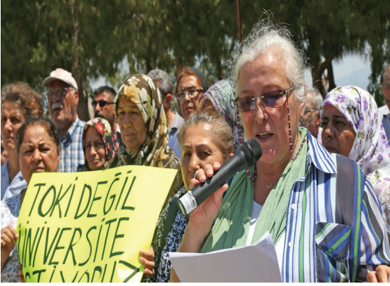
Uzundere’de 88 hektarlık alanın TOKİ’ye bedelsiz devredilmesine karşı protesto, 2019

Özellikle Kadın Meclisi’nin yürüttüğü çalışmalar, toplumsal cinsiyet eşitliği açısından önemli bir örnek teşkil etmektedir. Nazik Işık’ın aktardığına göre, Kadın Meclisi’nin önerileri arasında yer alan toplumsal cinsiyet eşitliği eğitimleri ve kadın dostu kent uygulamaları, Belediye tarafından benimsenmiş ve çeşitli projelerde uygulanmıştır (Nazik Işık, 2024).