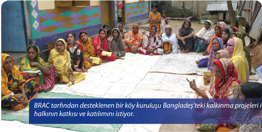
BRAC tarafından desteklenen bir köy kuruluşu Bangladeş'teki kalkınma projeleri için köy halkının katkısı ve katılımını istiyor.

Yerel bağışçılığın doğasında bulunan meşruiyet modeli bağışçıların kendi toplumlarında olumlu değişim yaratma gücü ve isteğine dayanıyor. Bu toplumlarda yaşayan kişiler aynı zamanda bağışçı olduklarından, destekledikleri kuruluşların iyi yönetilip yönetilmediği konusundaki kararı yine kendileri veriyorlar. Bu kuruluşların iyi yönetilmemesi durumunda bağışçılar desteklerini çekme gücünü de ellerinde tutuyorlar. Bu sayede, bağışçılar vakıfları ve benzer kuruluşlar kendilerini destekleyen yerel topluluklar karşısında dışarıdan bağışçılarda görüldenden farklı bir şekilde sorumlu tutuluyorlar. Buna ek olarak, toplumun ve liderlerinin de uyulmasının beklendiği normlar yaratılarak, daha şeffaf ve demokratik bir toplumun temelini de oluşturuyorlar. Yerel bağışçılık bu temel özelliğinden dolayı, uluslararası kalkınma gündeminde yer alan devletin şasisi süreci açısından, bilhassa kırılğan olarak nitelendirilen 45 devlet arasında, daha da önem kazanıyor. 13