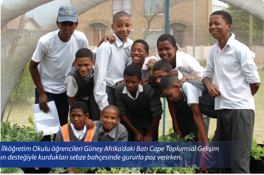
Protea İlköğretim Okulu öğrencileri Güney Afrika'daki Batı Cape Toplumsal Gelişim Vakfı'nın desteğiyle kurdukları sebze bahçesinde gururla poz verirken.

etkileşime girmek için kullanmak istediği durumlarda ortaya çıkıyor.